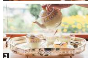
1 建物も庭も「いまだ完成途中」で、訪れるたびに新たな顔を見せてくれる2 3 什器も茶葉もスイーツも本物志向。季節の花のもと特別な時間が過ごせそう