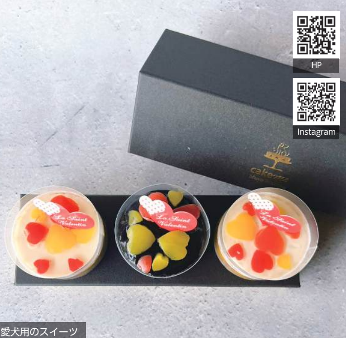
愛犬用のスイーツ