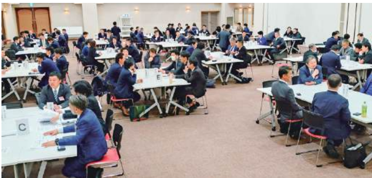
県内の青年部員が一堂に会し、親交を深めたビジネス交流会

その後のビジネス交流会では、「単会同士の交流から新たなビジネスチャンスの創出へ」をテーマに、商工会ごとに交流を図りました。地域を超えた異業種交流会となり、大いに賑わいました。