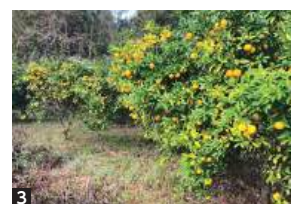
1 同店の看板商品「柚乃香」 2 業務用のパック商品 3 原料となるユズ。同店では青唐辛子も含めて自前で育てている

英彦山 柚乃香本舗 代表 林久秀 事業内容 ゆずこしょう製造販売 創業 1950(昭和25)年1月 スタッフ 3名 住所 田川郡添田町落合1287-3 TEL 0947-85-0870